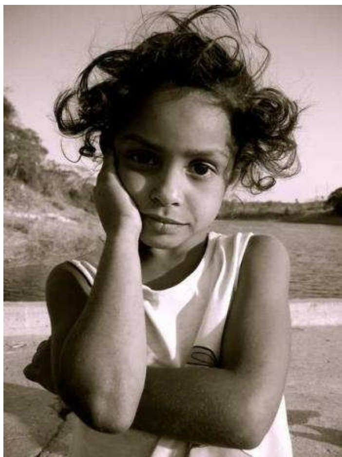
S/T. Fotografía, 100 x 75 cm Yelena Lorenzo Castañeda

en convencionalismos más o menos aceptados, existe siempre la posibilidad de buscar y, por ende, encontrar nuevas interpretaciones tanto por parte del mismo creador como del espectador, de innovar, de modificar este código visual de acuerdo con las transformaciones que haya sufrido la sociedad en su constante evolución.