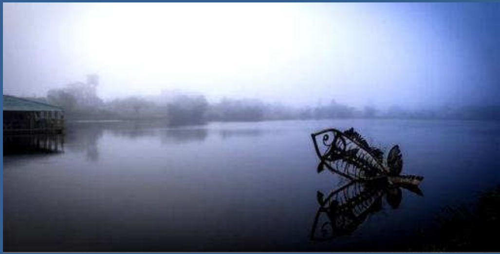
Solsticio. Fotografía, Humberto del Río, 100 x 50 cm