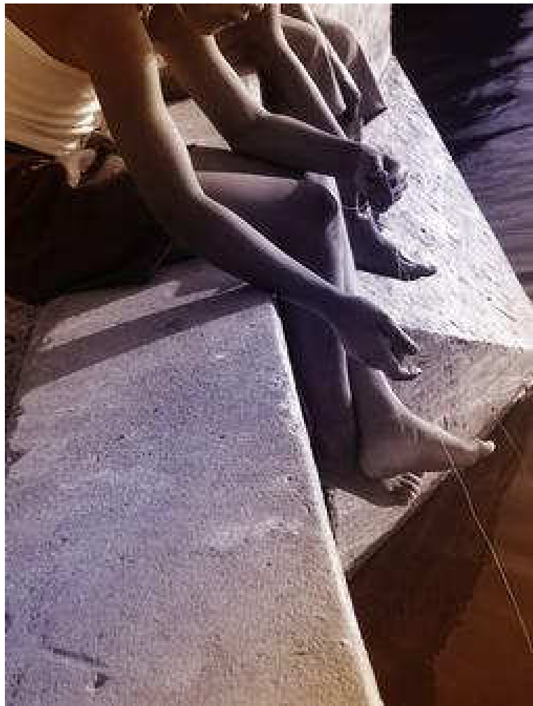
Fantasías inventadas. Fotografía, 61 x 40 cm Yelena Lorenzo Castañeda

Extremidades superiores e inferiores completan la dinámica del discurso fotográfico a través de la notoriedad con que son tratados en correspondencia con el rostro. El despliegue de las manos y los pies,