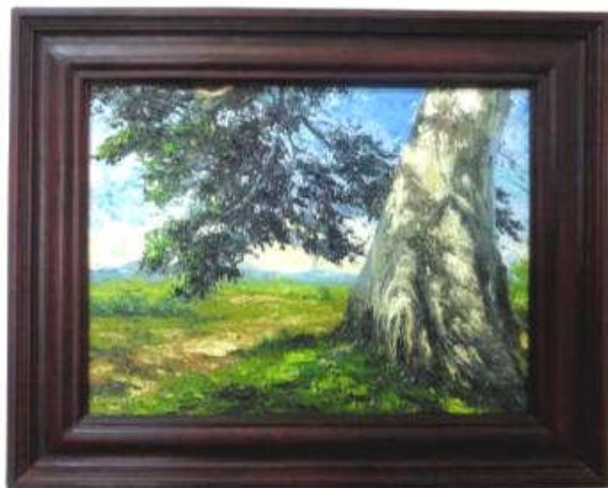
Descanso y meditación. Óleo/lienzo Casanova C. A

Salón de Paisaje, el cual en su actual edición exterioriza la innegable recurrencia al paisaje de los artistas de la región central.