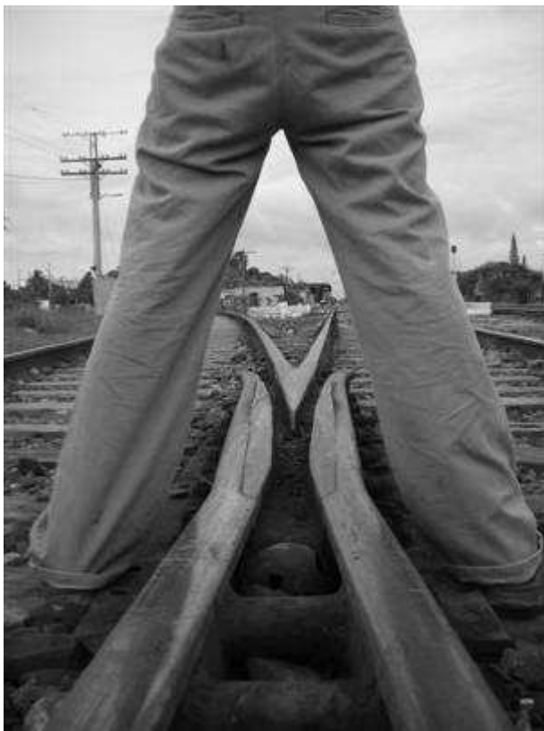
Yoanny Oliva Díaz. Incertidumbre . Fotografía. 41x30,5 cm.