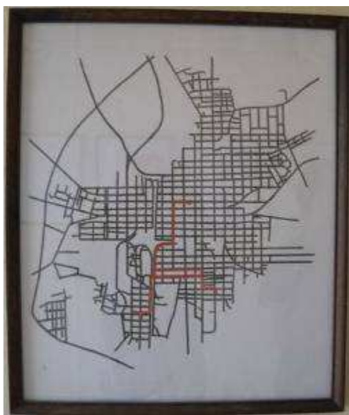
William Contreras. Trayecto , 3 de enero de 2005. Impresión gráfica. 24,5x21,5 cm.

La admisión de las obras se realizará en el Consejo, sito en Independencia No. 65 e/ Honorato del Castillo y Maceo, del 1 o al 15 de octubre de 2011 en el horario comprendido entre las 8:00 a.m. y las 12:00 m. Para más información llamar al 223900 o 201027.■