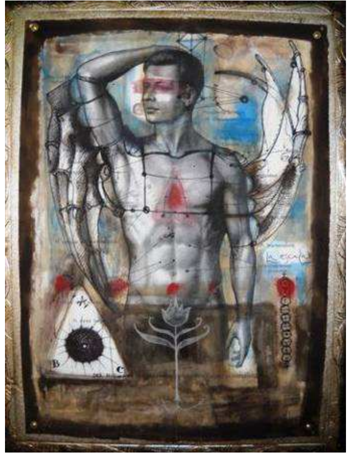
Carlos Guzmán. Guardianes (díptico). Mixta/cartulina. 150x125 cm.