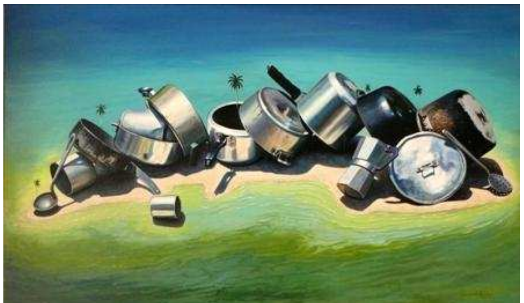
Renier Rodríguez. La isla encantada . Óleo/tela 80x120cm

Oníricos colores , en mi opinión, resume una etapa importante de la carrera artística de Reinier Rodríguez y abre paso a nuevas búsquedas en otros contextos, retomando ideas de años anteriores que aún funcionan por su excelente factura y adecuado concepto, a tono con las exigencias de nuestros tiempos. ■