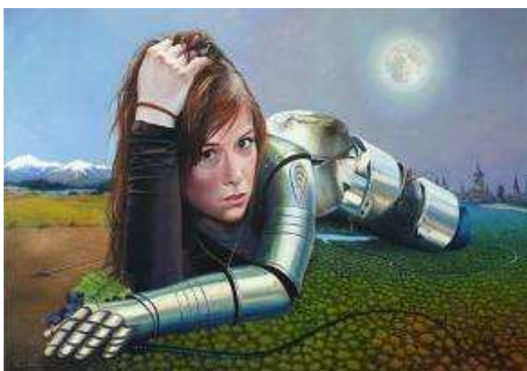
Renier Rodríguez. Europa . Óleo/tela 100x145 cm