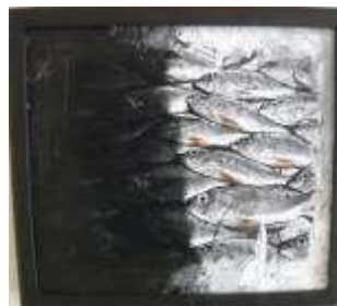
Lihéster Amador González. Cualquier paisaje (detalle). Instalación. Dimensiones variables.