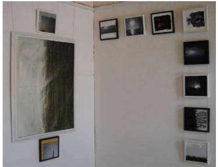
Lihéster Amador González. Cualquier paisaje . Instalación. Dimensiones variables.